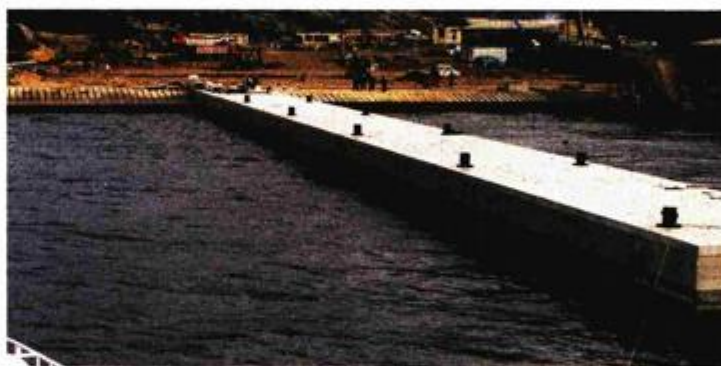
Nova luka za Rab

Također, više od 30 milijuna kuna proteklih je godina uloženo u domove za starije osobe s namjerom da se takvi domovi sagrađe na svim velikim otocima. Novac je uloženo u domove na Krku, Lošinju, Ugljanu, Dugom toku, Visu, Rabu, Braču i Korčuli, podsjeća Borić.