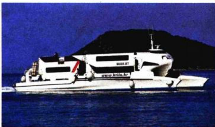
Katamaran za Lučku kapetaniju u Krilu Jesenicama