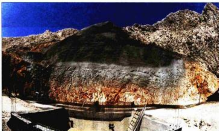
Vodosprema na Krku