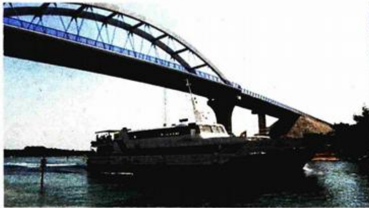
Most Mali Ždrelac