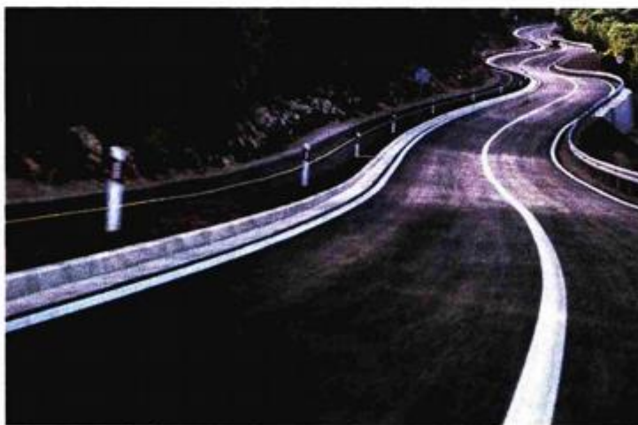
Prometnica na Krku