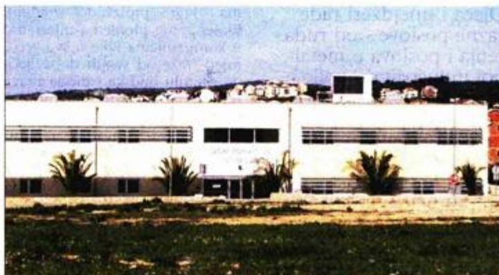
Dom zdravlja Novalja