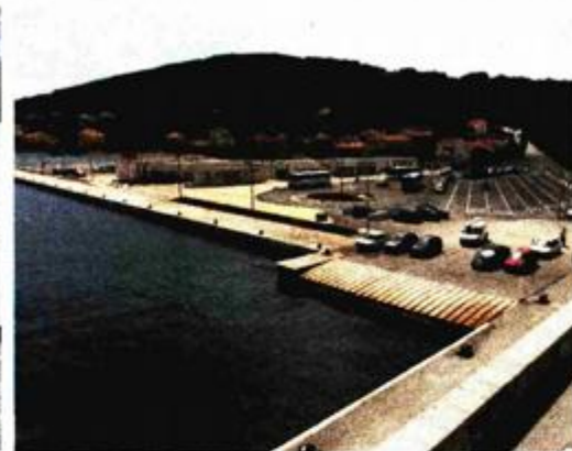
Nova luka u Preku