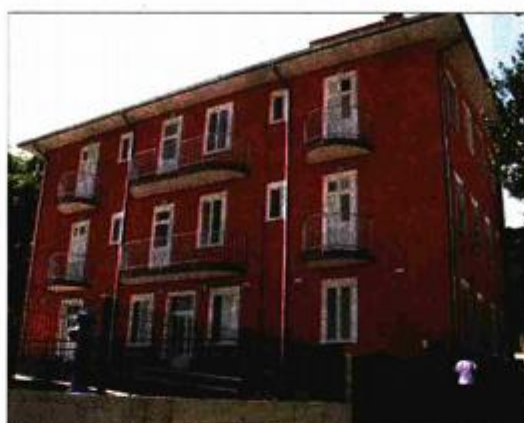
Dom za starije osobe u Preku