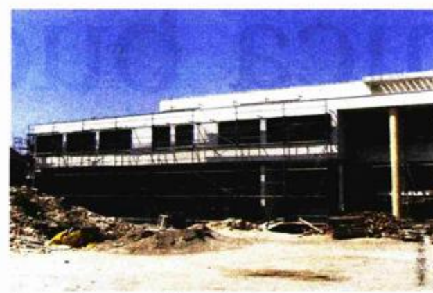
Nova zgrada osnovne škole na Čiovu