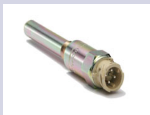
Kienzle Tachographen Sensor KITAS